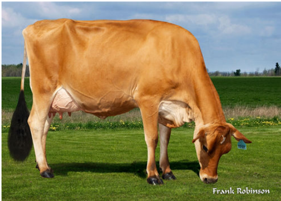
JX VIERRA PRESLEY {6}